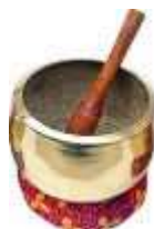
3 bols chantants