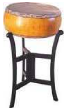
Tambour « Trong ban » et son trépied