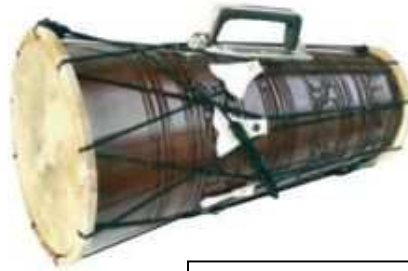
Tambour « Dholak »