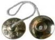
Une paire de crotales