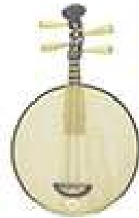
Guitare « yueh ch'in » (peut tenir sur un support à livres)