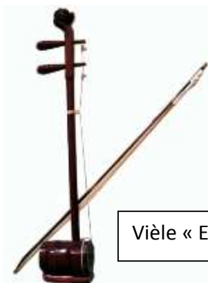
Vièle « Erhu »