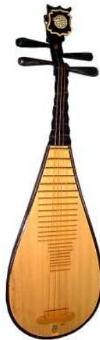
Luth « Pipa » (peut tenir sur un support à livres)