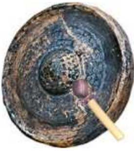
Gong à bulbe et son portique