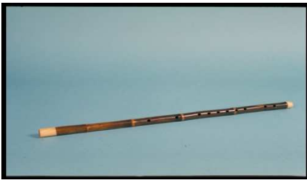
Flûte traversière « Ti tzu »