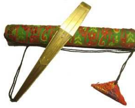
Guimbarde « Dan moi »