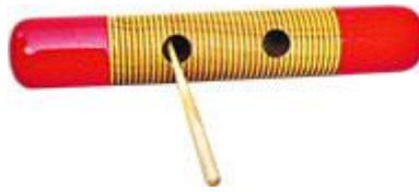
Guiro et baguette