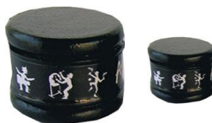
Shakers « parleurs » petit et grand modèle