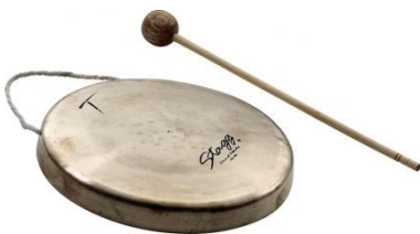
Gong et mailloche