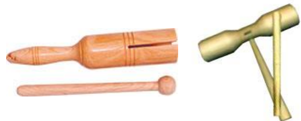
Tubes résonnants 1 et 2 tons et mailloches