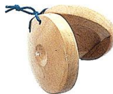
Castagnettes à doigts