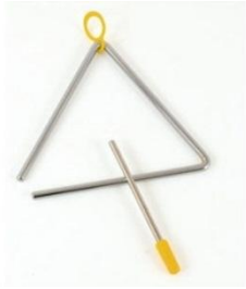
Triangles 10 et 15 cm et baguettes