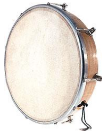
Tambourin avec baguette