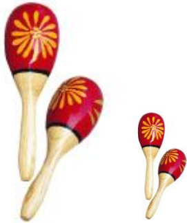
Maracas grand et petit modèle