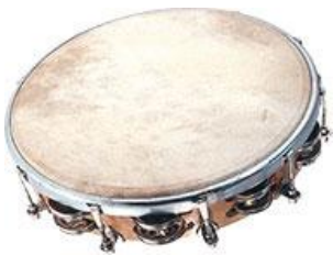
Tambourin avec cymbalettes