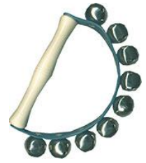
Poignée de grelots